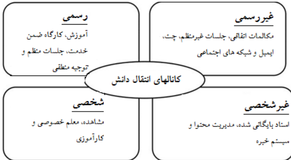
شکل شماره ۲- مکانیزم های انتقال دانش

مناسب است تا انتقال دانش بین بازیگران را برای غلبه بر موانع جغرافیایی و زمانی امکان پذیر کند. مکانیسم های انتقال دانش غیر شخصی به پشتیبانی از انتقال دانش به نوعی کدگذاری دانش و همچنین زیرساخت های ذخیره سازی نیاز دارند. برای تسهیل انتقال دانش مهم است که در طی فعالیت های بهبود فرآیند بر تمام فعالیت های ایجاد دانش و همچنین استفاده مجدد از دانش موجود تأکید شود (جیانتی، ۲۰۱۵) چهار نوع مکانیزم انتقال دانش در عمل دیده شده است (جیانتی، ۲۰۱۵):